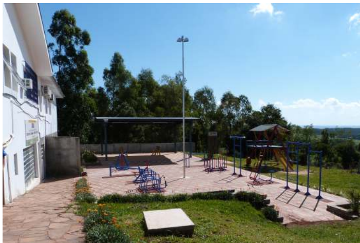
Academia da Saúde - R$ 80 mil (Ministério da Saúde)