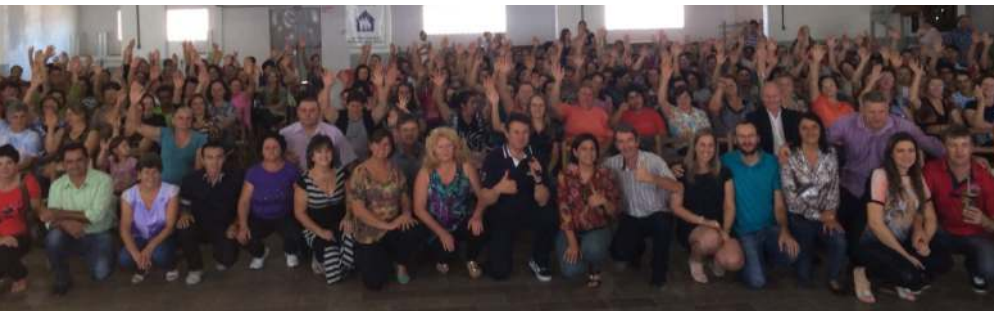
Palestra do Deputado Giovani Cherini para mulheres.