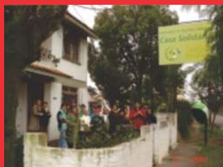
*Fechadas em 2014 POR FORÇA DA LEI Eleitoral 12.034